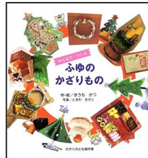
『みんなでつくるふゆのかざりもの』 きうち さく かつ/作 え ときわ まさと ますと/写真 ふくいんかんしよてん 福音館書店