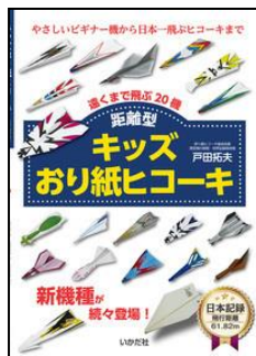
『距離型キッズおり紙ヒコーキ』 きよりがた 戸田 がみ 拓夫/著 いかだ社