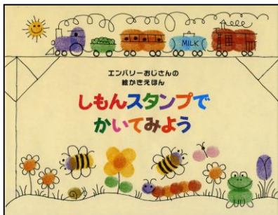
『しもんスタンプでかいてみよう』 エド・エンバリー/さく かいせいしゃ 偕成社